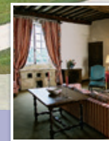
Le salon de la Tour Tower suite living