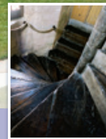
L'escalier classé Listed stairs