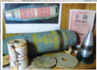
Tracts de propagande et leur obus.

Le 10 Juin 1944, l'armée américaine en fait un centre de transmissions puis le premier quartier général d'une nouvelle arme : la guerre psychologique.