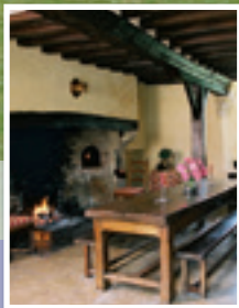
La cuisine médiévale Medieval kitchen