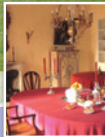
La salle à manger Dining room