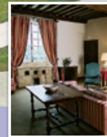
Le salon de la Tour Tower suite living