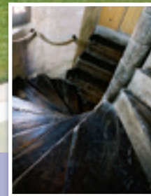
L'escalier classé Listed stairs