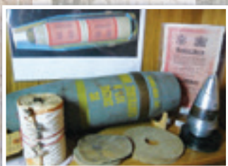
Tracts de propagande et leur obus.

Le 10 Juin 1944, l'armée américaine en fait un centre de transmissions puis le premier quartier général d'une nouvelle arme : la guerre psychologique.